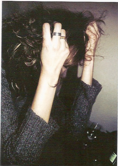
Selbstzweifel, Ängste, Stimmungsschwankungen oder psychosomatische Beschwerden sind typische Indikatoren für eine akute Mobbing-Symptomatik.

Begrifflich umfasst Mobbing bewusste und gezielte Angriffe auf die seelische Gesund-